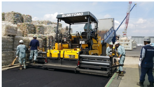
アスファルトフィニッシャー